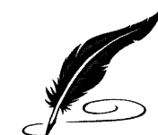
Școala Gimnazială GOIEȘTI