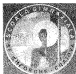
Școala Gimnazială „Sf. Gheorghe”